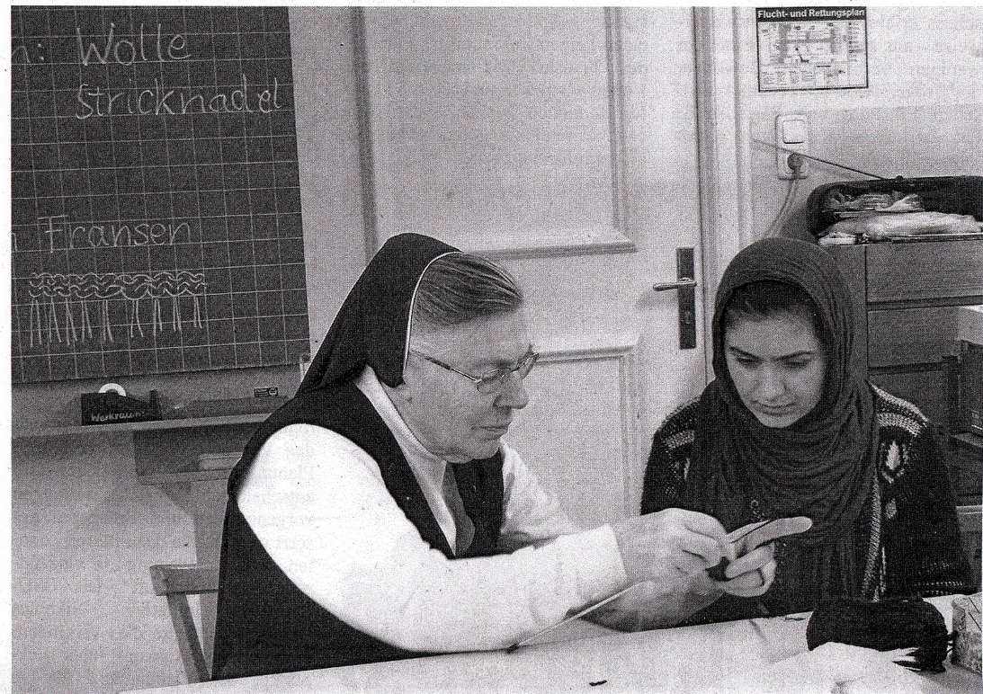
Erfolgreiches Integrationsprojekt der Armen Schulschwestern auf Seite 3

Haidhäuser Nachrichten Breisacher Straße 12, 81667 München